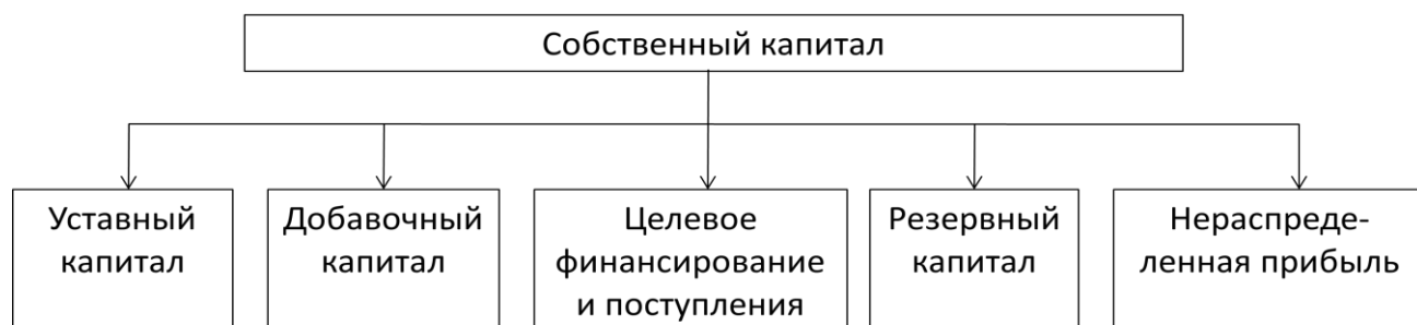
Схема 2. Структура собственных финансовых ресурсов

Финансовые ресурсы коммерческих организаций образуют ее собственный капитал. Он состоит из уставного, добавочного, резервного капитала; целевого финансирования и поступлений, нераспределенной прибыли.