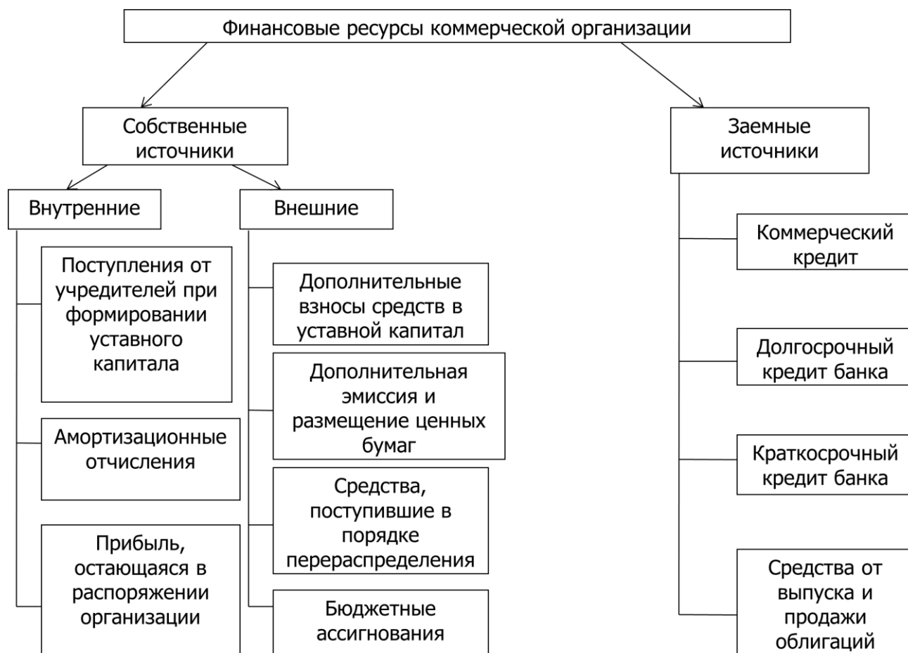
Схема 1. Финансовые ресурсы организации.

Собственные источники подразделяются так же на внешние и внутренние. 5