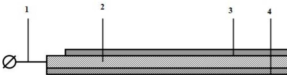
Рисунок 1 – Устройство актуатора: 1 – платиновая подложка, 2 – слой полианилина, 3 – сигнальный кабель, 4 – изоляционный лак

Для изучения электромеханических свойств был изготовлен актуатор в соответствии с рекомендациями. Установка позволяла фиксировать изменение положения актуатора в зависимости от потенциала подложки. В качестве допирующих анионов были выбрана: \text{Cl}^- , \text{Br}^- , \text{PO}_4^{3-} , \text{SO}_4^{2-} . Измерение производились при одинаковом значении pH 1-1,1. Степень окисления полианилина контролировали по потенциалу подложки подключенной по 3-хэлектродной схеме подключенной к потенциостату. Методика эксперимента заключалась в погружении ЭХА в оптическую кювету.