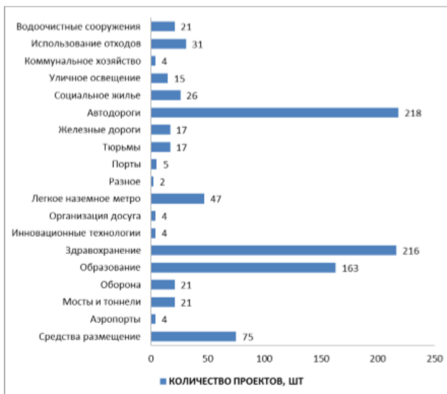
Рисунок 1. – Отрасли, в которых используются проекты ГЧП в мире

Как показано на рисунке 1, лидерами являются транспортная инфраструктура и социальная инфраструктура. При анализе применения ГЧП-проектов в различных государствах, рассматривая их в соответствии с классификацией, принятой в ООН, в зависимости от экономического и социального развития государства общая картина будет изменяться. На рисунке 2 рассмотрена схема применения ГЧП-проектов в странах «Большой семерки» (США, Канада, Великобритания, Франция, Германия, Италия, Япония) по отраслям экономики. Можно сравнить рисунки 1 и 2, в результате сравнения мы заметим, что по сравнению с общей картиной в государствах «Большой семерки» проекты именно транспортной инфраструктуры стоят далеко не на лидирующем месте. В странах «Большой семерки» места с первого по третье занимают здравоохранение, образование и автодороги.