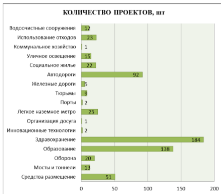
Рисунок 2. – Анализ использования проектов ГЧП по отраслям в странах «Большой семерки»