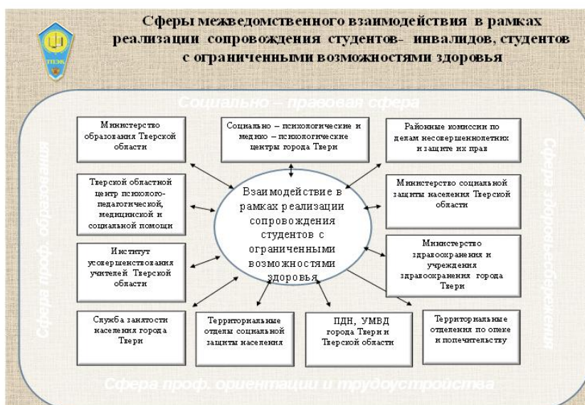
Рис.2. Схема межведомственного взаимодействия в рамках реализации сопровождения студентов – инвалидов, студентов с ограниченными возможностями здоровья

Решение всех этих задач невозможно без конструктивного, позитивного и эффективного межведомственного взаимодействия. В нашем колледже схема межведомственного взаимодействия представлена в виде схемы жизнеобеспечения подростка (рис.2).