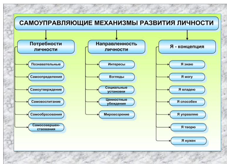
Рис.1 Самоуправляющие механизмы развития личности

Студенческая среда - это тот фактор, который оказывает большое