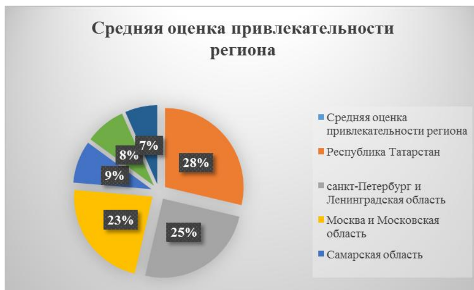
Рис.4 – Средняя оценка привлекательности регионов.

Согласно социальному опросу среди детей и молодежи на Территории Республики Татарстан авторами была выявлена средняя оценка по привлекательности нашего региона. Результаты представлены на рисунке 4.