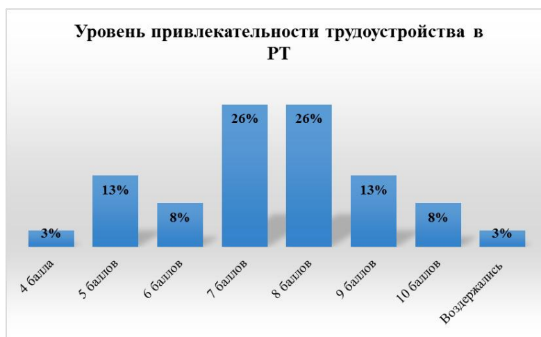
Рис.2 – Оценка респондентов по 10 – балльной шкале уровень привлекательности трудоустройства в Республике Татарстан.

Уровень привлекательности трудоустройства для молодого поколения в Республике Татарстан авторы исследования оценили, как 26% на 7 и 8 баллов согласно 10 балльной шкале (0– наименее привлекателен, 10 – очень привлекателен). Результаты представлены на рисунке 2.